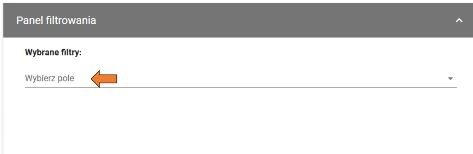
Rysunek 15 Panel filtrowania

Poniżej prezentowana jest tabela przedstawiająca możliwości filtrowania wydarzeń: